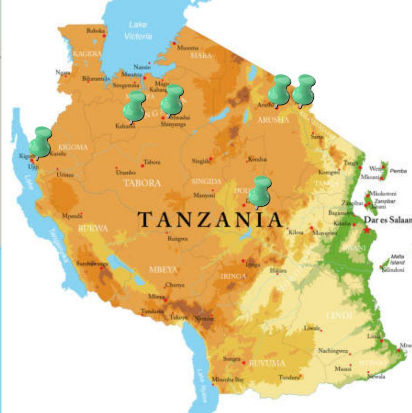
Miejsca w których odbyły się rekolekcje lub spotkania oazowe